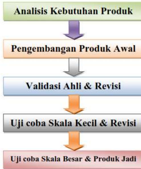
Gambar 2. Desain model 5 langkah Puslitjaknov

Desain model puslitjaknov tahun 2008, dikembangkan oleh tim yang bekerja pada pusat penelitian dan pengembangan kebijakan kementerian pendidikan dan kebudayaan yang dahulu kala dikenal dengan Departemen Pendidikan Nasional. Desain model ini berawal dari langkah/tahapan penelitian dan pengembangan Borg & Gall yang telah disederhanakan. Berikut langkah atau tahapan dari desain model 5 langkah/tahapan puslitjaknov.